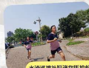
水泳巡禮社區巡馬拉松，認識社區並鍛鍊強健體魄。

本校榮獲臺中市國中107學年度「提升學生體適能」績優學校，為培養學生健全身心，養成運動習慣，發展運動社團，例如：拳擊、舞蹈、飛盤、桌球、美語足球、籃球等等，尤其拳擊、舞蹈團隊，歷年在全市或全國性比賽中，都有卓越的表現，更大大提高學生的自信與學習興趣。今年更積極爭取經費辦理「108年學生游泳課程計畫」，讓學生能有游泳學習體驗外，更可以讓學生學習團體生活，培養與人相處的人際關係。