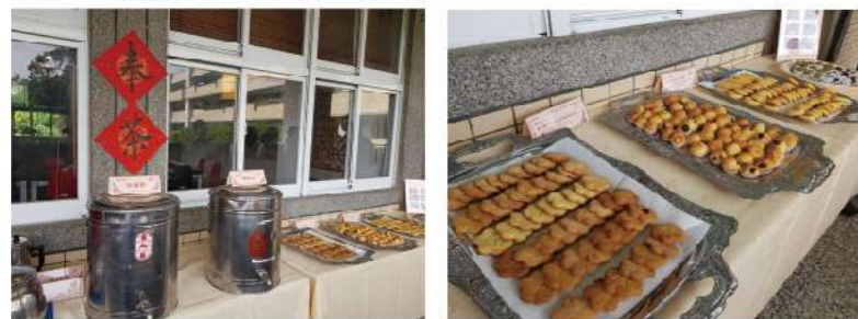
備有學校梅園自家種植醃製的梅子、梅茶，還有學生親手製作的手工梅花餅乾與梅香椰子球，與來賓分享「梅」好滋味。

大德國中社區共讀站10月31日正式啟用。將舊有學校圖書館改造成多元彈性運用的「社區共讀站」。共讀站擁有明亮空間、豐富硬體設施，未來將結合多元學習課程，開放學校圖書資源與社區居民共享。開幕當天並同時舉辦「閱讀台中-2019城市閱讀系列講座」邀請梨山賓館副總林閔政先生分享「山那邊夢想書房」的故事。