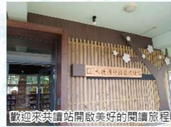
歡迎來共讀站開啟美好的閱讀旅程

窗外的綠色喬木羅漢松、小葉欖仁，還有松鼠、黑冠麻鷺在枝頭上引領翹盼、白頭翁的悅耳鳴聲，是共讀站最珍貴的自然景觀資源，成排的窗邊高腳椅吧檯區，讓讀者不時可以抬頭眺望窗外的美景；陽光篩下來的綠意光影變化適合佐書香，燃起讀者對於閱讀森林的渴望，使閱讀不再是嚴肅的個人苦修，而成為輕鬆愜意的生活調劑。