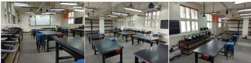
充實手動工具、電動工具等設備，培養學生動手做和發現問題的能力。

108課綱的生活科技課程著重培養學生動手「做」的能力、使「用」工具與科技產品的能力，以及發想之能力；培養學生創造、明辨、問題解決、邏輯與運算等高層次思考。大德國中生活科技老師依照課程規劃打造符合學生的全新生活科技教室，期待透過工具、材料、資源、動手設計實作等，培養學生設計與創造科技工具的知能與素養，以因應科技快速發展的需求。