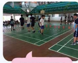
出隊團隊訓練動力齊，倡導學校運動風氣。

為了多方提升學生體適能，每年辦理「水泳巡禮社區迷你馬拉松」，以社區路跑鼓勵同學慢跑健身，再輔以每週兩次升旗後全校慢跑大撲滿及體育課程之實施、校慶運動會之舉辦，在學生時代就養成運動的興趣與習慣，終身受用不盡，為將來的學習打下更穩固的根基。