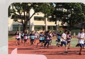
跑步大撲滿，建立健康體育識。

為了多方提升學生體適能，每年辦理「水泳巡禮社區迷你馬拉松」，以社區路跑鼓勵同學慢跑健身，再輔以每週兩次升旗後全校慢跑大撲滿及體育課程之實施、校慶運動會之舉辦，在學生時代就養成運動的興趣與習慣，終身受用不盡，為將來的學習打下更穩固的根基。