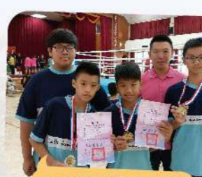
拳擊訓練練有成，榮獲市長盃1銀2銅佳績。