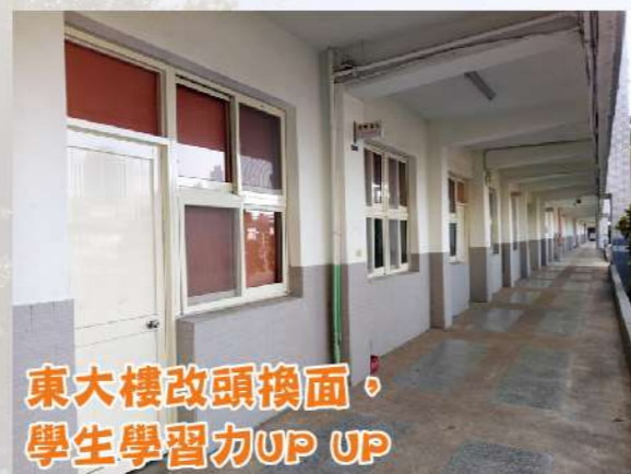
東大樓改頭換面， 學生學習力UP UP

好環境需依賴上級來建設，依賴家長來認同，依賴學校來教育，依賴學生來愛護，環環相扣並取得最大共識，才能讓學校成長茁壯又有前瞻遠見。