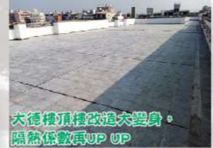
大德樓頂樓改進大變身， 隔熱保溫UP UP