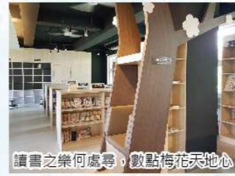
讀書之樂何處尋，數點梅花天地心