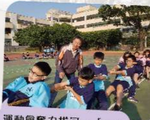
運動會奮力拔河，「一、二、殺！」絕不輕易放手。