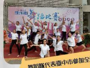
舞蹈隊代表臺中市參加全國舞蹈比賽獲得佳績。