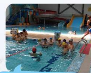
游泳體驗營使學生不怕水，擁有保護自己生命的能力。