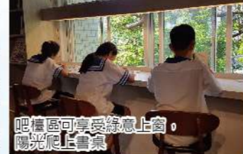
吧檯區可享受綠意上窗，陽光呢喃書聲