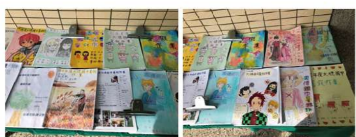
教師採用多元的評量方式，行為或技能檢核表、情意或態度評量表、圖文日記以及歷程檔案評量等，標扎標打建立學生素養。

各領域教師在教學上發揮專業設計「情境化」及「生活化」的多元主題作業，採用素養導向的課程與教學，重視學生的學習歷程與學習成果，從學生的「學習表現」來評量其學習的狀況或成果，紮實的打穩孩子閱讀能力，藉由專業提問設計，在訓練閱讀素養的同時，加強應用閱讀理解能力來分析和解決問題、建立批判性思考的基本功。