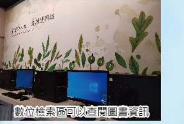
數位檢索區可以查閱圖書資訊