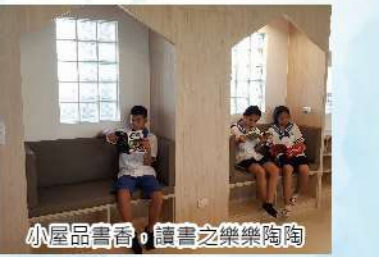
小屋品書香，讀書之樂樂陶陶

入口旁的閱讀小屋，是共讀站裡最有趣的角落，讀者可以用舒服的姿勢在此休憩、閱讀，有如在大自然的木屋中，可放鬆自在探索書中的美好，牆面鑲嵌的水紋玻璃磚則為小屋引入了走廊上與煦的自然光，也兼顧了讀者的閱讀私密性。