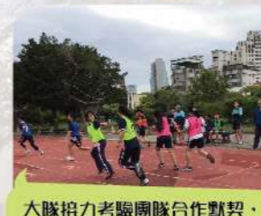
大隊接力考驗團隊合作默契，馳騁跑道為班級榮譽而戰。