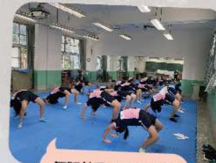
舞蹈社團外聘專業師資，平日認真練習。