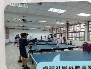
桌球社團外聘專業教練，提升學生體適能。